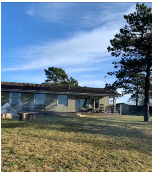
Billede af Onkel Toms hytte.

Vi prioriterer højt, at barnet deltager i det omgivende samfund med tilpasset pædagogisk støtte, afhængigt af barnets funktionsniveau og motivation. Nogle børn